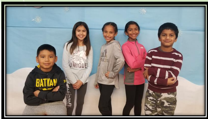
Second 9-Weeks Elite Eagles